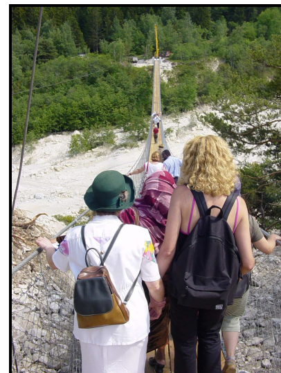
Une des sorties annuelles de l'Espace interculturel Sierre au pont du Bhoutan